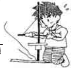
ひあこしたいけん